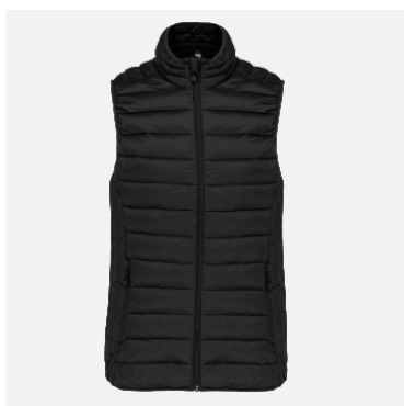
Doudoune légère Azaël 100% Polyamide Couleurs : noir