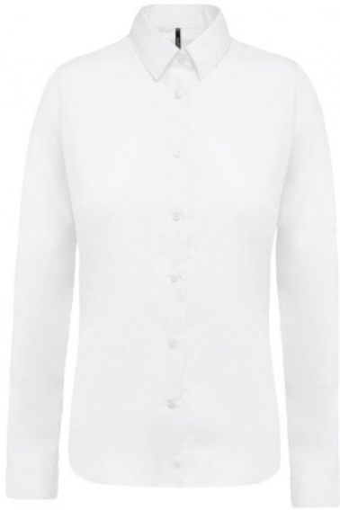
Chemise popeline Audrey