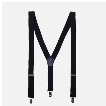
Bretelles à pinces Basile Couleurs : noir