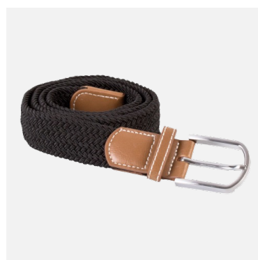
Ceinture tressée Boston 52% Caoutchouc 48% Polypropylène Couleurs : noir