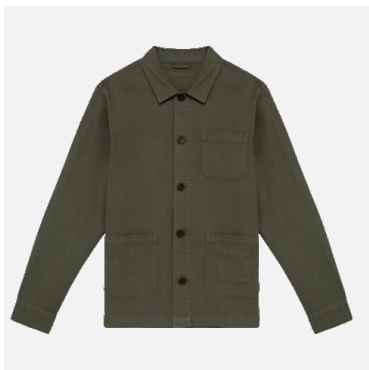
Veste Robin 50% Coton 50% Lin Couleurs : Kakhi