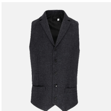
Gilet chevrons homme Franck 50% Polyester 45% Laine 5% Fibres Mélangées Couleurs : charcoal