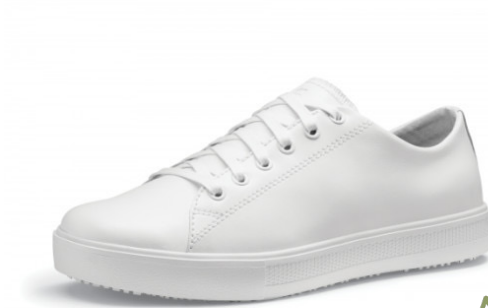
Sneakers mixte Aloïs