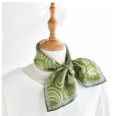
Foulard en soie Naturelle Celadon 100% Soie naturelle Couleurs : vert clair et blanc