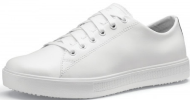
Sneakers mixte Alois