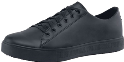
Sneakers mixte Alois