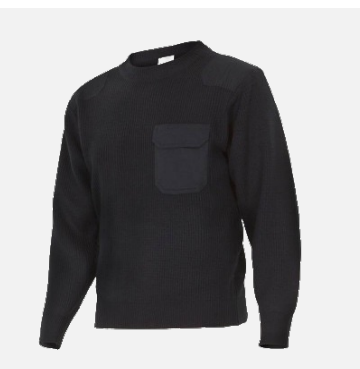
Pull col rond Edouard 100% Acrylique Couleurs : blanc, noir, khaki