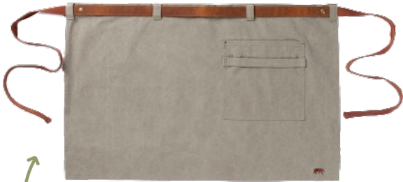
Tablier p'tit Emile