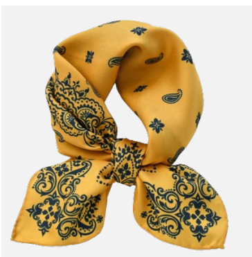
Foulard en soie Naturelle Safran 100% Soie naturelle Couleurs : jaune et vert foncé