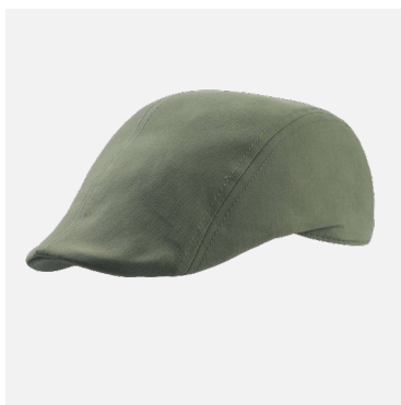
Gavroche Gabin 100% Coton Couleurs : noir, olive