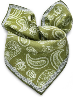
Foulard en soie naturelle Celadon