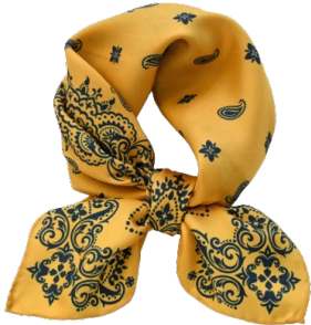
Foulard en soie naturelle Safran