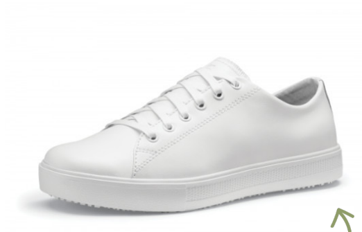
Sneakers mixte Alois