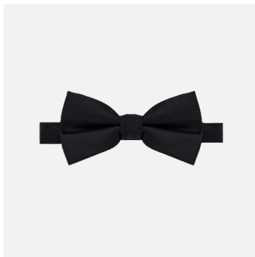
Nœud papillon Roger 100% Polyester Couleurs : noir