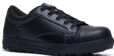
Chaussures Fergus Alois