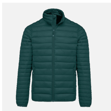
Doudoune légère Théo 100% Polyamide Couleurs : noir, mineral green