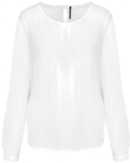
Blouse crêpe Romane