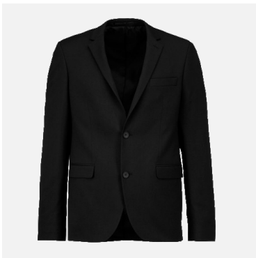
Veste Stéphane 64% Polyester 24% Viscose 2% Elasthanne Couleurs : noir