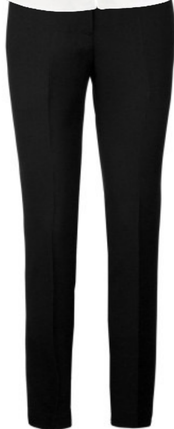
Pantalon tailleur Stéphanie