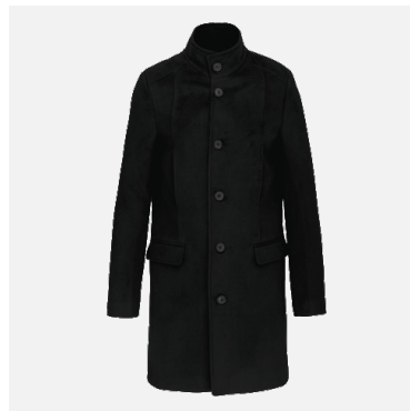
Manteau Benoit 79% Polyester 18% Viscose 3% Elasthanne Couleurs : noir